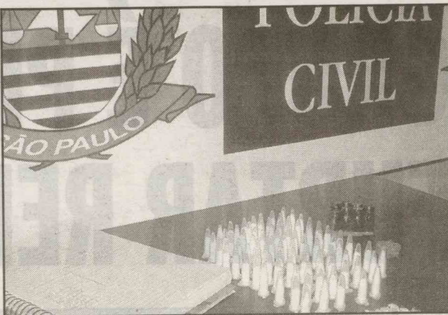
Houve a apreensão de maconha, cocaína e cheirinho de loló

Também foram apreendidos sete tubos plásticos vazios, R$ 90,00, um caderno com anotações, oito cartões de recarga de celular, um recibo de depósito bancário, uma folha de papel de como misturar co-