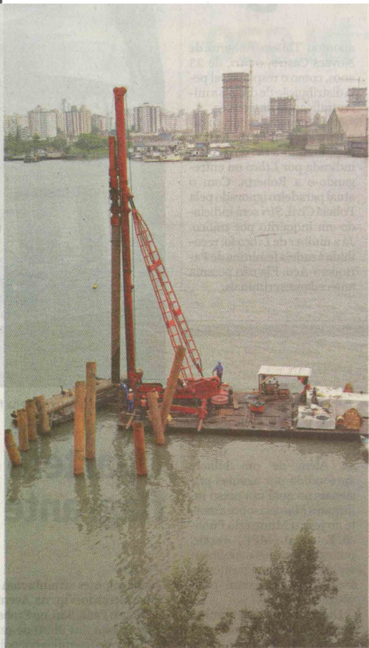
Bate-estacas está colocando as fundações para um novo atracadouro

Desde o acidente com o navio apenas um dos três atracadouros (o flutuante) está funcio-